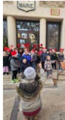
Chant des enfants