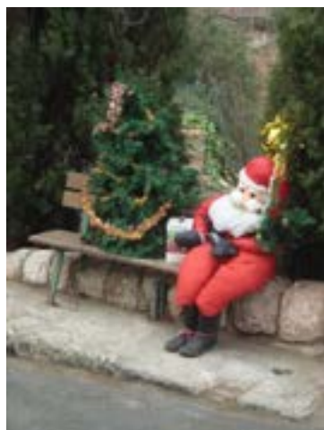
Décor de rue

21 décembre : Caramany. Place de la Mairie. Chants des enfants de l'école et vente de pâtisseries au profit des élèves par les parents d'élèves.