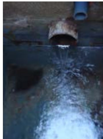
Débit de la source